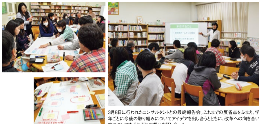
3月8日に行われたコンサルタントとの最終報告会。これまでの反省点をふまえ、学年ごとに今後の取り組みについてアイデアを出し合うとともに、改革への向き合い方についてもそれぞれの想いを話した。

日々の膨大な業務や部活動指導、保護者対応などに追われる教員。長時間労働が問題視されている学校現場に、働き方改革の風が吹き始めた。高槻市立北大冠小学校では、一昨年から業務改善に向けて先生たちが奮闘している。