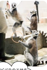
カピバラのエサを狙ったキュレーターさんに叱られました。