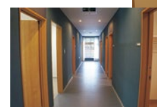
2階に1人部屋が30部屋、1階に2人部屋13部屋があり、ゲストルームを含め、最大60名収容可能となっている。