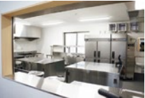
選手たちの栄養管理を行い、食事面もサポートしていく。写真は食堂内の厨房。