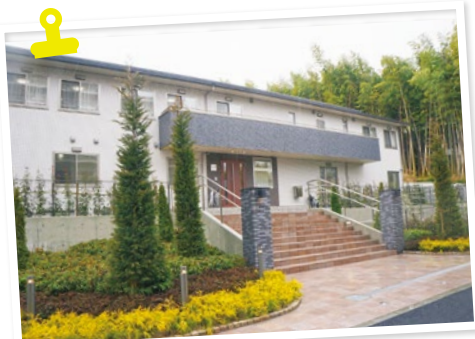
昨年4/5(水)に地鎮祭が行われ、今年3/16(金)に竣工した。

まで期間限定で登場。映し出された花が吹きかける息に合わせて舞い上がる、インタラクティブな作品です。ぜひ息を吹きかけてみて!