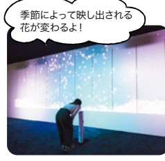
季節によって映し出される花が変わるよ!

まで期間限定で登場。映し出された花が吹きかける息に合わせて舞い上がる、インタラクティブな作品です。ぜひ息を吹きかけてみて!