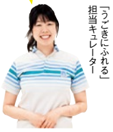
担当キュレーター「つぎにふれる」