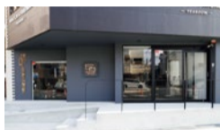
今年4月にOPENしたばかりの清潔感溢れるクリニック。JR高槻駅北口から徒歩3分と駅チカ便利で通いやすい!