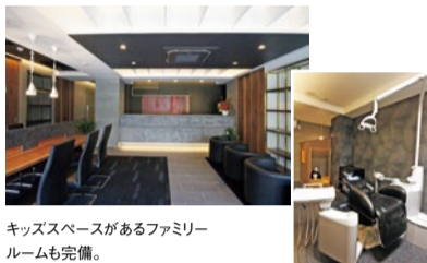
キッズスペースがあるファミリールームも完備。