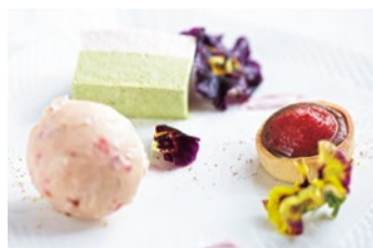
季節を感じるデザートプレート