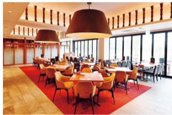
3～24名の少人数個室や最大120名まで宴会利用もOK!

立命館大学内に ある落ち着いた雰囲気 の同店。ママ友 のちよつぱり贅沢な ランチや宴会利用 にピッタリ。サッポ ロビール直営なの でビールがとにかく 美味しく!プロ が管理する生ビール はサッポロ生や 琥珀エビスなど5 種と豊富。ビールと の相性を考えた料理 やビールを隠し 味にしたこだわり メニューも多数。