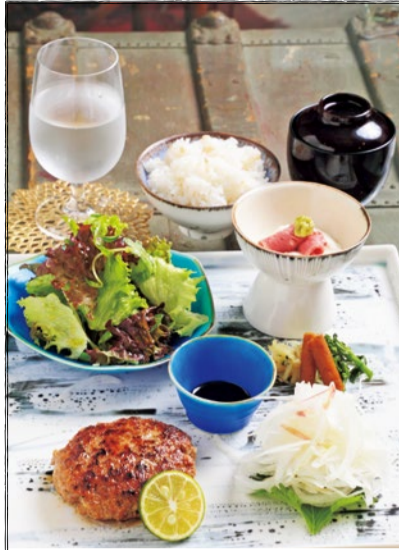
淡路島くぬぎぎ牛ハンバーグプレート 1,800円