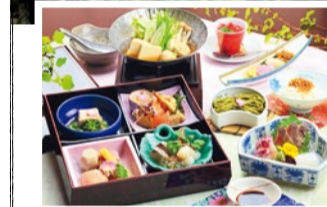
季節の食材を使った春の川床会席 (3,800円) + 1,500円で飲み放題も可 ※写真はイメージ

箕面公園の風物詩となっている「箕面川床」。和の趣がただよぶ「音羽山荘梅屋敷」では、滝道の川沿いに床が敷かれ、自然溢れる箕面川のせせらぎと木々の自然を間近に眺めながら、ゆったりとした食事が楽しめる。食事の後は、小旅行気分の新緑の滝道の散策もおすすめ。