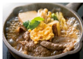
「おすすめの逸品」から「牛肉のすき焼き風 鉄板焼き仕立て」。目の前の鉄板で甘辛く焼き上げてくれる。アツアツをぜひ。(ディナー限定、4/16~5/31)