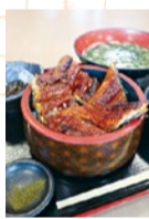
極厚の鰻はボリューム満点!

記念すべき5月は超目玉「銀蔵よくばり定食」。淡路産穴子の天ぷら、お造り3種、銀だら照り焼きの贅沢盛り！さらに「うなぎ井」は通常1,200円！(+600円)→「うなぎW定食(鰻倍)」に！