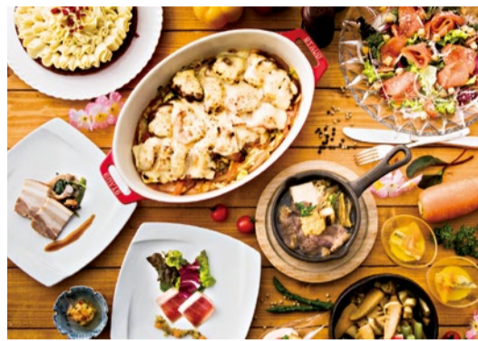
(上)春のお祝いフェア。おすすめの逸品をはじめ、和洋中バイキングが揃う。