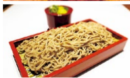
箕面本店のみで、平日15時以降提供の温冷選べる「そば」

この記事持参で箕面本店のみ 特製蒸しプリンをサービス (平日のみ※5/1、2は除く、数量限定、箕面本店のみ、5月末まで) E