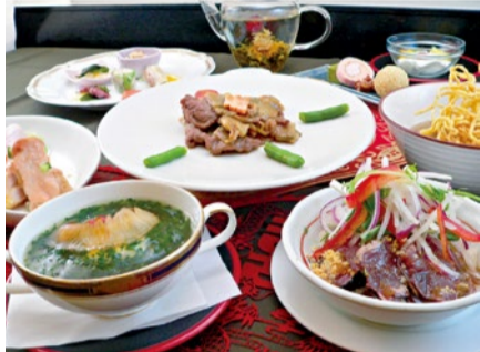
ランチならコーヒー・紅茶もセルフにてセット!