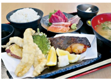
銀蔵のよくばり定食は「焼き揚げ造り」の3つのおいしいを詰め込んだ夢の豪華定食!