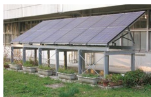
吹田市立古江台小学校に設置された太陽光発電