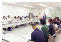
地域交流会研究会は誰でも参加可能で、遅刻早退、発言も自由で、その気軽さと情報量の多さで16年以上も継続されている。