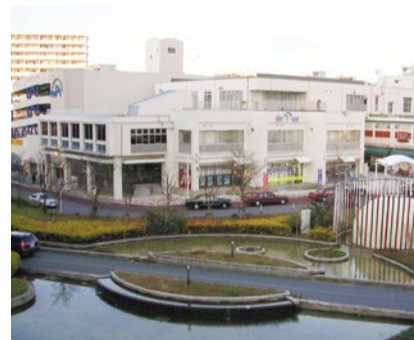
昭和42年に開設した「dios北千里」(大阪府吹田市古江台4丁目119番地)