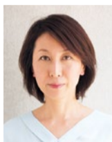
(before) いつもはスタイリング剤でボリュームをつくりながらセット。動きのあるスタイルは「ボサボサ」に見え心地よく過ごせる上質なプライベートサロン。髪だけでなくメイク法なども気軽に相談できる。