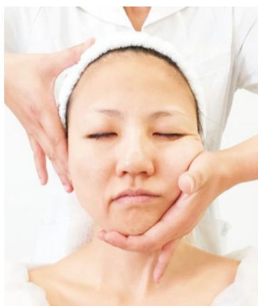
完全個室で気兼ねなく落ち着いてお手入れを受けられる。行きとどいた接客やラグジュアリーな雰囲気でも人気。大好評につき、1ヶ月前の予約がオススメ。

これで スッキリ ! 『造顔マッサージ® (30分) 3,240円』 若返り・肌質改善・小顔と、女性の「なんとかしたい!」に応えるスペシャルなお手入れ。熟練のエステティシャンが田中有久子先生から受け継ぐ数種類のハンドマッサージにより、静脈やリンパへ老廃物を流し込む。