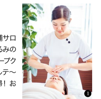
①本格エイジングケアを受けられると40・50代から人気。②天然クレイパックで毛穴汚れと老化角質を徹底除去。③お得な価格で美肌脱毛スタート!④お腹回りがすっきりボディキャブで脂肪分解!梅田店限定、関西初の最新導入!