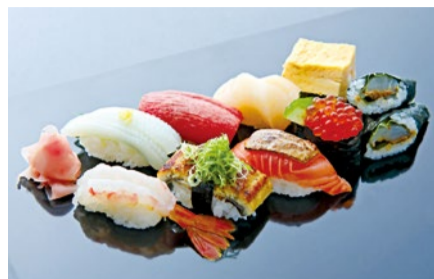
内容：先付、フォアグラサーモンと季節のにぎりを含む握り8貫、手巻、赤だし ※前日までの予約で一口蒸物付(昼のおまかせのみ)