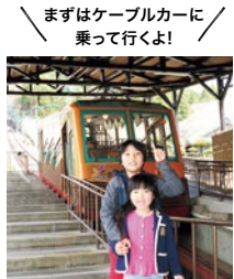
読者モデルの怪くと慧ちゃん