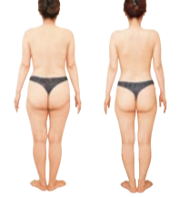
2か月間キャピリポスリムを受けて体重-6kg、ウエスト-10cmに成功!

①ファットレスマットで代謝を上げ「老廃物のごみ箱」と言われる鎖骨のリンパ出口を開けておく。このステップをしておくことで次の効果がUP! ②キャピテーションでハンドでは届かない体の奥の脂肪細胞をまで念入りに溶かす。③ラジオ波+LEDで血流改善。気になる部位の内臓脂肪まで徹底的に燃やす。④ゲルマバンドで大量発汗。頭、デコルテ、背中、二の腕を30分間テックスマッサージして老廃物や毒素を一気に排出。