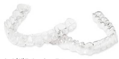
インビザライン・システム

目立たない矯正 インビザライン 歯を矯正する方法の一つに、透明のマウスピース「アラライナー」を使うインビザライン・システムがあります。大きなメリットは一般矯正と比べて口腔衛生に良いことです。食事や歯磨きの時は簡単に取り外しできますので、口の中を清潔に保ちやすく、2週間に1度新しいアラライナーに換えるため衛生的で、痛みが少ないのも特長です。また、3次元コンピュータで治療のシミュレーションを行い、個々の症例に適合す