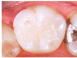
after 治療痕がわからないほどキレイ。