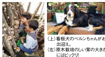
(上)看板犬のベルンちゃんがお出迎え。 (左)原木栽培のしい茸の大きさはビックリ!

北摂・阪神間からすぐ、旬のしい茸を黒毛牛や地鶏などと味わえる炭火BBQが人気の同園。希少な原木栽培にこだわり、1年以上熟成させた肉厚しい茸はうま味がジュワッと広がる。ブランコや手作り遊具、パドミントンの貸し出しもあるのでファミリーで一日たっぷり楽しめる。新名神高速道路も開通し、車でのアクセスがますます便利に!