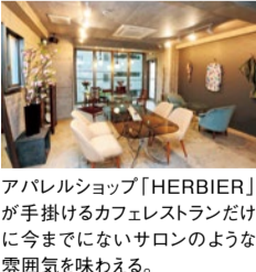
アパレルショップ「HERBIER」が手掛けるカフェレストランだけに今までにないサロンのような雰囲気を味わえる。

menu ●淡路島くぬぎざ牛ハンバーグプレート(デザート・コーヒー付)...1,800円 ●宇治抹茶 おしるこセット...600円 ※パーティーや貸切予約も可