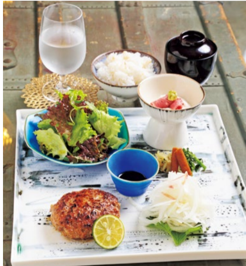
くぬぎざ牛ハンバーグすだちボン酢/しゃぶしゃぶ山芋わさび醤油/淡路島契約農家の野菜/旬のお漬物/麦ごはん/赤だし/コーヒー、デザート

アンティーク家具と季節の花で装飾されたお洒落な店内でジャズの心地よいBGMを聴きながら、時間を気にせず最高のひとときを過ごす。おすすめの食事メニューはこだわりの贅沢プレートをゆつくり楽しんで。