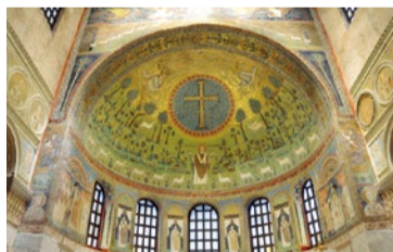
(上)海の潟に浮かぶ水の都ヴェネツィア。 (左)ラヴェンナ郊外サンタポルлина・レ・イン・クラッセのモザイク画。