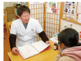
漢方の専門用語はなるべく使わず、わかりやすく説明してくれる

「お医者さんに痩せなさいと言われた」「40歳を超えてから体重が落ちにくくなっている」。腰痛や高血圧など体重増によって生じる身体への負担は様々あるが、それらを健康的なダイエットの提案で改善へ導いてくれるのが、「漢方の心堂薬店」。個人個人の体質にあわせた漢方の処方と、生活習慣の見直しアドバイス等でアプローチしてくれる。負担の少ない健康に配慮した提案なのでリバウンドしにくい体質づくりにも役立つという。相談は無料。気になる症状がある方は、一度訪れてみては。