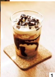
1 暑いこれからの季節にうれしい、本格珈琲の美味しいフラペが登場。 2 ミントブルーが印象的な温かみのある落ち着いた空間でほっこりとして一時を過ごしてみよう。