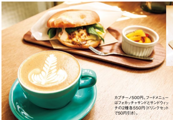
カプチーノ500円。フードメニューはフォカッチャサンドとサンドウィッチの2種各550円(ドリンクセットで50円引き)。