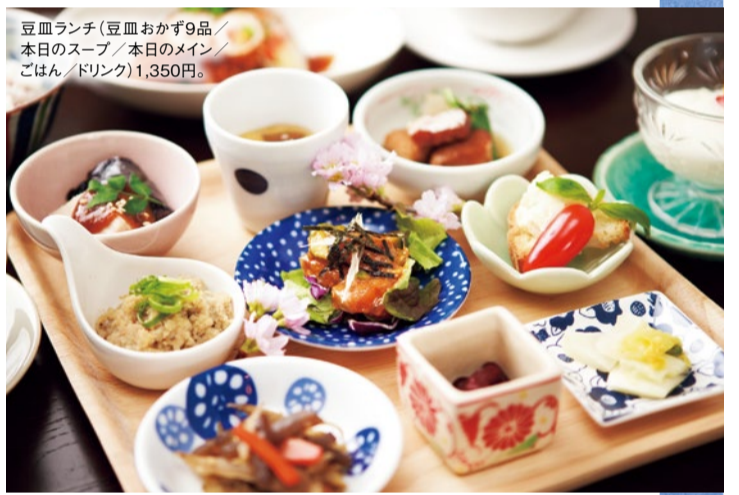
豆皿ランチ(豆皿おかず9品/本日のスープ/本日のメイン/ごはん/ドリンク)1,350円。

「シティライフを見た」と豆皿ランチ注文の方、ミニデザートをプレゼント!(7月末まで) ※価格は全て税別