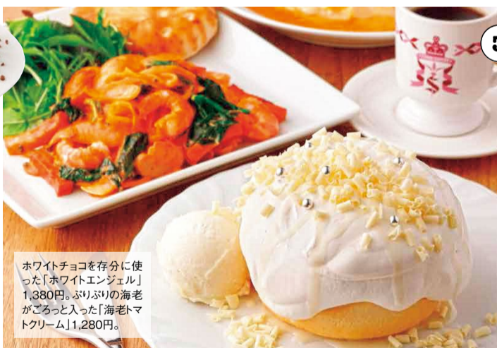
ホワイトチョコを存分に使った「ホワイトエンジェル」1,380円。ふりふりの海老がごろっと入った「海老トマトクリーム」1,280円。