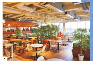
1 かわいいテント風テーブル席のほか、テラス席もある店内。2 Deliプレッドドリンクセット830円。この日は「NY(ニューヨーク)ルーベンサンドイッチ」パストラミビーフとザワークラウトを挟んだ絶品メニュー。