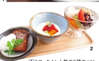
1 カフェタイム人気の5種のベリータルト630円。 2 豆皿スイーツセット(ドリンク付)1,000円。おまかせ豆皿デザート3種の盛り合わせ。