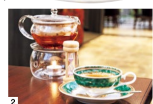
1 生地の中にチョコランチとクリームの中にもチョコが。チョコ好きにはたまらない「ダークエンジェル」1,180円 2 こだわりの紅茶メニューも豊富。