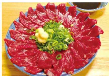
※写真は特選赤身100gの盛り付けイメージ 特選赤身100g.....1,490円 6/1(金) 価格改定予定