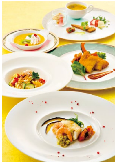
ランチコース「レガール」。メニュー内容は下記。