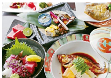
季節の単品料理や地酒、焼酎、ウイスキーなども豊富。

千里丘店 摂津市千里丘1-13-23 インP駐車場サービスあり ☎06-6319-8290 馬刺し 千里丘 で検索 山田第2小文 豊中市北緑丘1-1-10 専用駐車場あり(店舗から南に40m) ☎06-6152-8294 馬刺し 豊中 で検索