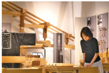
「道具と手仕事」コーナーでは、多様性と独自性を誇る日本の大工道具の種類や仕組み、使い方を紹介。