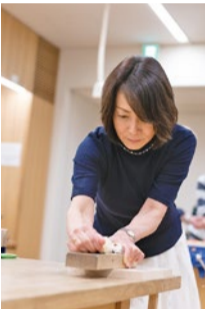
木工室では工作、体験などイベントを定期的に開催している。詳細はwebにて。

1610年創業の建築会社、竹中工務店が開設した大工道具の博物館。経済の発展とともに忘れ去られつつある伝統文化を残し、後世に伝えていくことを目的に設立された。大工道具の歴史に始まり、宮大工や数寄屋大工の美しく精巧な手仕事、名工と呼ばれた鍛冶たちの手がけた道具など7つのコーナーに分かれて木造建築に関わる様々なものが展示されている。大工道具に触れてみたり、木の香りを