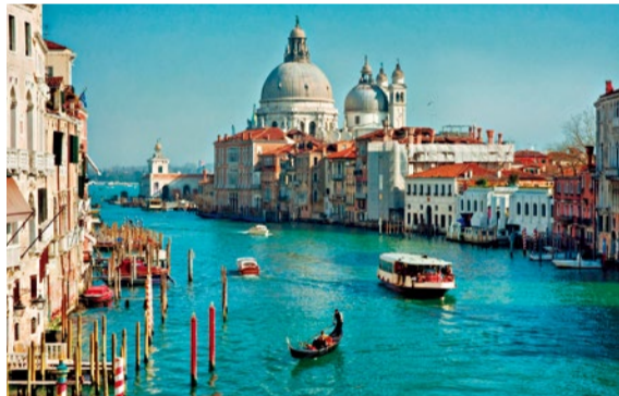
(上)海の潟に浮かぶ水の都ヴェネツィア。 (左)ラヴェンナ郊外サンタポルリナーレ・イン・クラッセのモザイク画。

— 学びを嗜む — 3年間しっかりと専門学科を学ぶ「シニア専修コース」を始め、生涯学習に力を注ぐ同校。キャンパスには若い学生と同様に、様々な世代が集い、学習やサークル活動に励んでいる。こうした取り組みをさらに進めるため、4月から新たに「社会連携推進センター」を発足した。今後は、地域・シニアの方々と学生が一緒になってお店を運営したり、共通のテーマについて研究したり、画期的なコラボが実現するかも。「今は祖父母と離れて暮らす学生が多い。互いの世代にとって刺激になる活動を考えたい」と同センターの松葉所長。新たな大学の学びのカタチとして、注目を集めている。