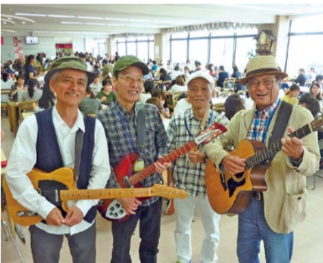
シニア専修コースはサークル活動も多彩。軽音楽同好会では、学生の前で青春の音楽を届ける機会も。