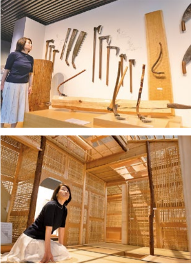
スケルトンになった茶室の実物大模型をはじめ、麗しき伝統美の世界を垣間見ることができる。