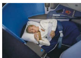
せっかくの旅。移動もビジネスクラスを利用するなど、こだわってみては？