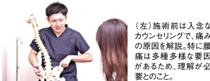
(左)施術前は入念なカウンセリングで、痛みの原因を解説。特に腰痛は多種多様な要因があるため、理解が必要とのこと。