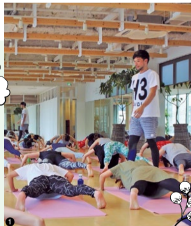
1. 東洋医学×ヨガを合わせた「五臓ヨガ」。6/3の2周年イベントでは1日限りのスペシャルレッスンも!