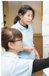
一つのユニットに入居者は約10人、スタッフは5人を配置。

られない「介護難民」が危惧されている。だからこそ施設長は「地域の介護の相談窓口を目指す」という。「介護の問題は分かりにくく、たらい回しになりがちです。私たちが地域のワンストップサービスを実践することで介護難民は出ません」。