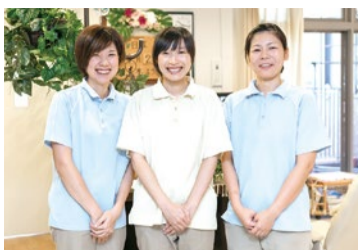
明るく元気なスタッフ

豊中千寿園が抱く危機感とは「入居要件が要介護3以上に引き上げられたことに加え、所得の高い方や一定以上の資産のある方は介護保険の自己負担額が2割に引き上げられたこと。以前の当施設の待機者は常時数百人でしたが、現在は30数人です。それは入居したい人が居なくなったのではなく、重度の要介護状態になるまで入居できなくなったというところ。2025年には団塊世代の全員が75歳以上になり、介護や医療にかかる費用が激増、必要な介護を受け