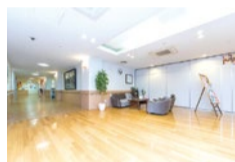
1階の広々としたエントランス