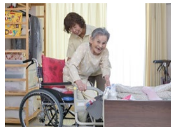
入居者と笑顔で語り合うケアスタッフ

「そこで私たちは無資格・未経験の方に働いてもらいながら人材を育てることにしました。将来は介護福祉士やケアマネジャーへの道も開けるシステムを構築していきます。近所の方や定年後のシニアの方にもぜひ参加していただきたいと思っています」。