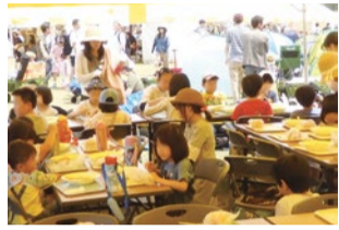
ロハスフェスタ万博でのこども食堂の様子

理券配布前から行列となり、10分ほどで整理券配布が終了。フルーツたっぷりの甘口カレーは相変わらず子どもに大人気!パンにつけながら、きれいに食べてくれました。今回も北摂エリアのこども食堂をご紹介したチラシをお渡ししましたが、回を重ねるごとにこども食堂へ行ったことがあるという人が増えてきています。