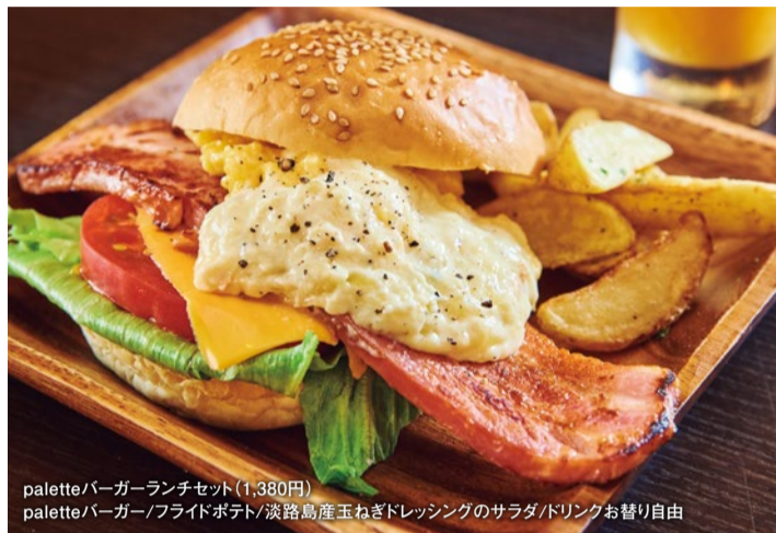
palette/バーガーランチセット(1,380円)