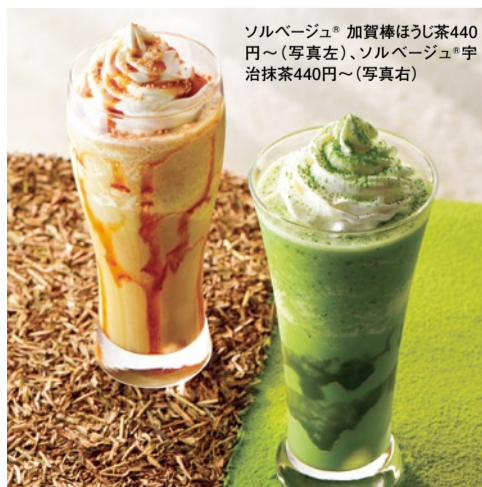
ソルベージュ® 加賀棒ほうじ茶440円～(写真左)、ソルベージュ® 宇治抹茶440円～(写真右)

箕面の滝の麓にある商店街の一角に佇む、都会の喧騒を忘れさせてくれる落ち着いた雰囲気のカフェ。2週間毎に変わる季節を感じられるドリンクやパスタ、ケーキが楽しめる。喫煙席・禁煙席がありテラスにはドッグアンカーが設置されていてペットと一緒にでもゆったりとくつろげる。