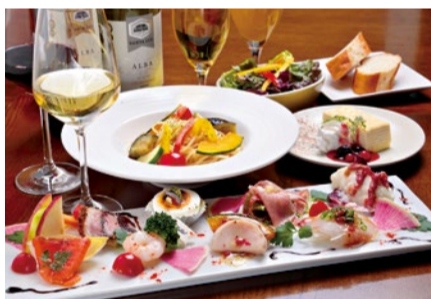
ランチママ会コース(要予約) ※内容は季節によって異なる前菜盛り合わせ10種/シェフのおまかせパスタ/サラダ/パン/食べ放題/ドリンク/デザート