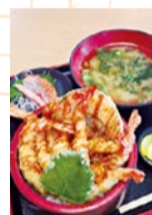
天然海老がモリモリで+100円で海老増量もOK!