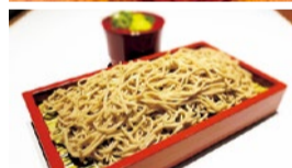
箕面本店のみで、平日15時以降提供の温冷選べる「そば」

この記事持参で 箕面本店のみ 特製蒸しプリンをサービス (平日のみ、数量限定、箕面本店のみ、6月末まで)