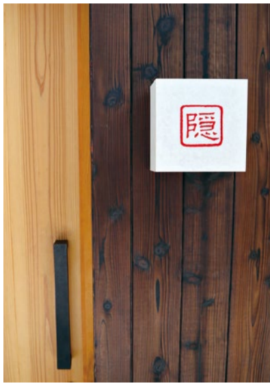
建物地下1Fのまさに隠れ家のような存在。