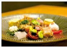
席数に限りがあるので予約がベター。

熱海の有名旅館など和食の世界で長年営業してきた店主が腕を振るう「隠」。職人技が成す料理の数々に虜になる客も多い同店から、6月1日からコースランチが新たにスタートする。「食材に手を加えずに」和食の真髄はそのままに、リーズナブルに堪能することができる。ランチは基本的に、予約の必要はなく「気軽に立ち寄ってください」とのこと。シンプルなのに奥深いその味をぜひ堪能して。織部焼や有田焼などの趣のある器に盛られた料理を静かな空間でゆっくり味わいたい。