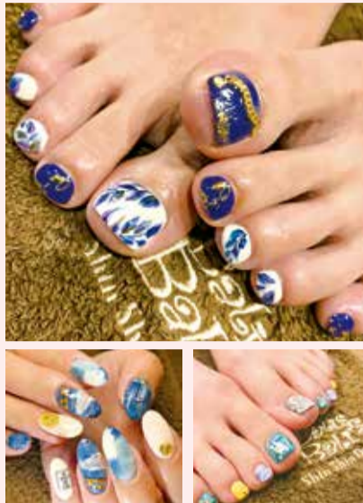
利用シーンやイメージカラーなど要望も親身に聞いてくれる。すべておまかせにするお客さまも。

「仕上がりが繊細で綺麗!」と評判の手描きネイルのサロン。利用者のほとんどがリピーターになるほどの人気。現役グラフィックデザイナーのスタッフが、要望のデザインはもちろん、部分的なアレンジや個性を活かした上質なデザインまで幅広く提案してくれる。完全予約制なので施術中は完全プライベート空間。スタッフは気さくで話しやすいので、気の張らない女子会みたいに盛り上がりすぎること多いのだとか。大人女子の贅沢な空間として、ぜひ利用してみてください。