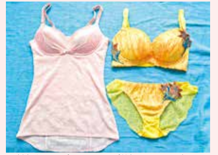
▲(左)バストアップシェイパーカップ付(ピンク/ベージュ) 7,560円→SALE 2,980円 (右)ブラショーツセット 5,400円

薄着になるとうっかり見た目年齢を上げているのが下着からはみ出た肉。その流れた肉をシェイパーやホールド力のあるブラジャーで正しい位置に整えると、鎖骨の下にふくらみが出てたちまちメリハリボディに! 「ここまで丁寧に接客してくれるお店は今までなかった!」と言われるほど納得するまで選べて、気さくなオーナーがじっくり相談に乗ってくれるので遠方からの来店も多い。