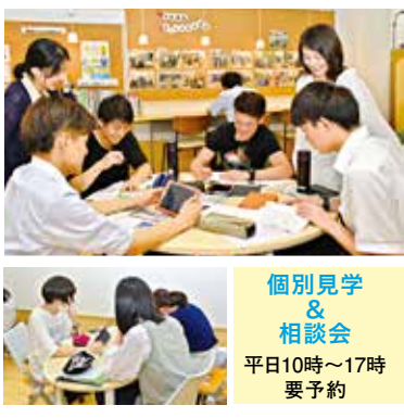
個別見学 & 相談会 平日10時～17時 要予約