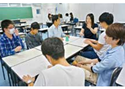
(上)少人数制で生徒と先生の距離が近いのも魅力。