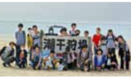
(左)自由参加の行事や修学旅行などを通して友達作りもできる。

大阪府認可で、今年創立27年目を迎えた伝統ある通信制高校。「友人関係がうまくいかない」「学習についていけない」など、通信制高校を選択する理由は様々。同校では全日型の「ベーシック」、週1～3日の「マイスタイル」、完全個別の「ホームサポート」と生徒一人ひとりの多様性を認め、それぞれに合ったクラスが揃う。ベーシッククラスでは、漢検や英検など継続学習を通して資格取得にチャレンジし、卒業後の進路も視野に入れた学びができることと評判だ。できることを伸ばし、可能性を広げる同校へまずは見学を。