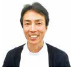
総持寺バランス整体院 多久院長