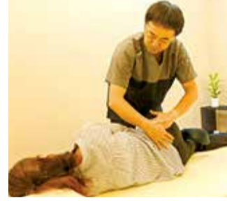
トレーニングのプロでもある院長が「自分自身でもよくする方法」まで教えてくれる。 HP内、@LINEから無料相談もできる。

数多くの臨床経験と細かく丁寧な問診で85%が原因不定と言われていた腰痛の原因を探り改善へ導いてくれる同院。その施術は筋肉・筋膜といった表面的な部分へのアプローチだけでなく、身体の土台となる部分を元の状態に戻してくれる。トータルボディサポート 高槻クリニカル整体院 教~Atsu~ 高槻市中川町10-5-1F 営/10時~20時 日・祝定休、不定休 ☎072-676-5088