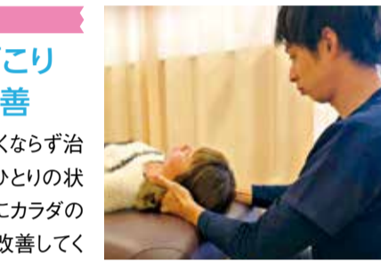
評判を聞きつけ遠方から通われる方も多い専門院。親身になってくれるので、まずは気軽に相談してみてください。

慢性的な腰痛や肩こり、坐骨神経痛などよくなる治療院を転々としていませんか?同院は、一人ひとりの状態に合わせた手技による施術で、骨盤を中心にカラダのバランスを整え、長年の辛い痛みや不快感を改善してくれる。湿布や痛み止めを日々使っている人におすすめ。