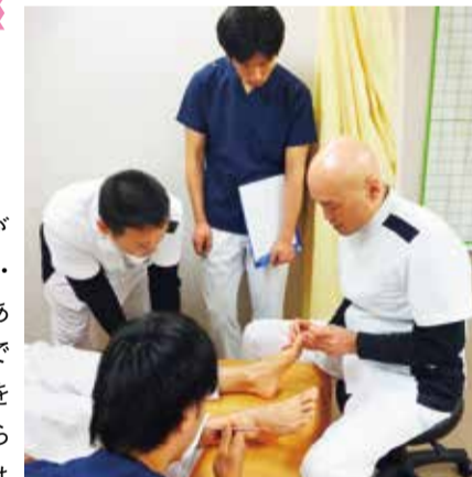
▲代表木方さんの施術手法は業界内でも有名で、他院院長にも教えている。

パンプスやミュール、サンダルなど足の露出が増えるこれからのシーズン。外反母趾や巻き爪・O脚など自信の持てない足で、おしゃれな靴をあきらめていませんか?同院では、TVなどメディアでもおなじみの足指ソムリエがあなたの足の悩みを徹底改善してくれる。遠くは沖縄・広島・静岡からわざわざ通う人がいるほど。外反母趾や巻き爪は放っておいても改善はされず、むしろ悪化し脚をかばう歩き方になり、不格好なO脚や寝たきりといった重大症状に発展することも…。今年の夏にむけて、まずは気軽に相談してみてください!