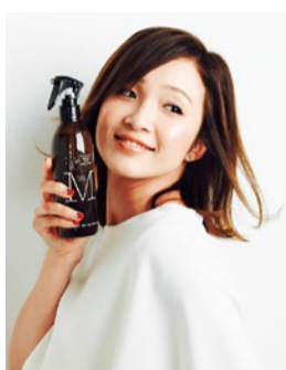
aoイチオシ商品「PUT ON MAGIC〜小さな小顔のための生ミスト〜」300ml 4,500円(税別)

〔西宮〕 aO アオ 西宮市江上町4-1 営/10時~19時 月曜・第1、第3日曜日定休 ☎0798-38-1900 ※完全予約制 instagram@tatsuya2455