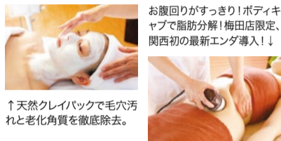
↑天然クレイパックで毛穴汚れと老化角質を徹底除去。

お腹回りがすっきり！ボディキャブで脂肪分解！梅田店限定、関西初の最新エンダ導入！！