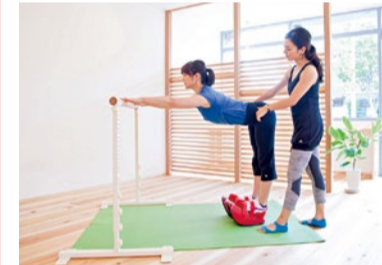
腰痛や肩こりの改善、姿勢改善、O脚X脚の改善、ボディメイク、ひき締めなど各々の目的に合わせ、体に負担をかけることなく取り組める。ストレス解消&リフレッシュ効果も抜群! 「気持ちのいい」身体を手に入れよう!