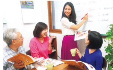
「楽しむことが上達の近道」と考えるアットホームなレッスンは、間違いを恐れずどんどん発言できるので自然と実践的な英語が身につく。忙しくても電話一本で振替えOKなので無理無駄なく通いやすいのもポイントだ。

趣味だけでなく「頑張る何かがある」というアナタ。オクトワンでは、ヨガパスポート(1,890円)購入でレッスンスタンプを集めると、世界でも権威あるヨガ協会「全米ヨガアライアンス」認定のインストラクター資格取得が可能に! 資格というカタチある目標がハリのある日常に導いてくれるはず!