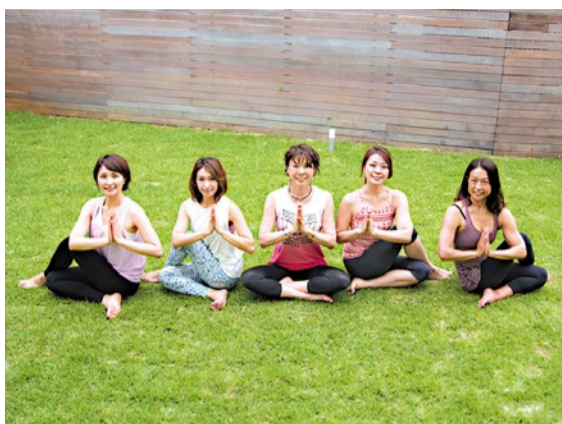
昨年オープンした沖繩2号店の宜野湾スタジオ。阪神間・神戸で会員数20,000人を突破!ますます目が離せない!