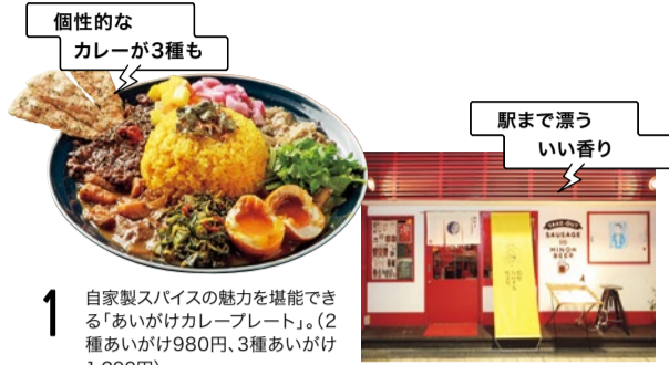
個性的なカレーが3種も