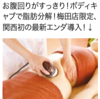
お腹回りがすっきり!ボディキャブで脂肪分解!梅田店限定、関西初の最新エンダ導入!!