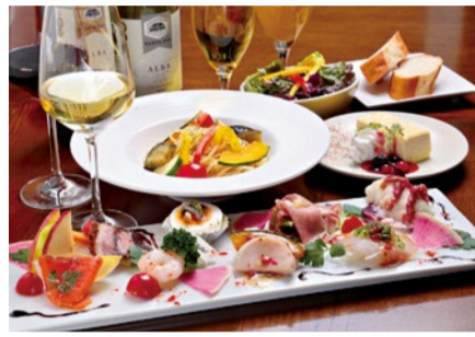
ランチママ会コース(要予約) ※内容は季節によって異なる 前菜盛り合わせ10種/シーフのおまかせパスタ/サラダ/パン食べ放題/ドリンク/デザート