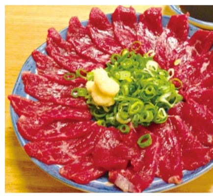
(上) ※写真は特選赤身100gの盛り付けイメージ