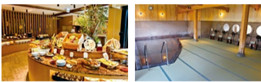
おばんざい〜デザートまで種類豊富!