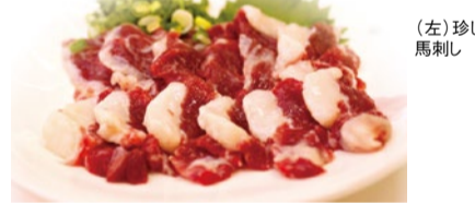
(左) 珍しい馬カルビの馬刺し