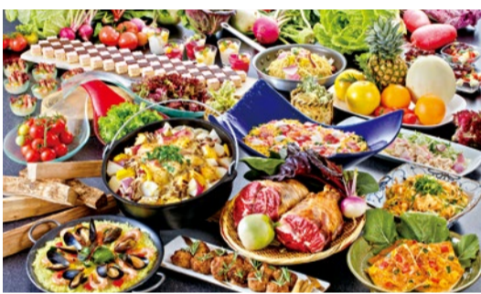
自家農園&地元野菜もたっぷり見た目にも美しい。