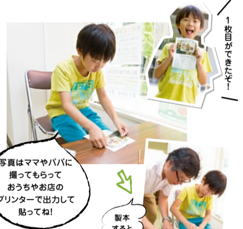
写真はママやパパに撮ってもらって おうちやお店のプリンターで出力して貼ってね!