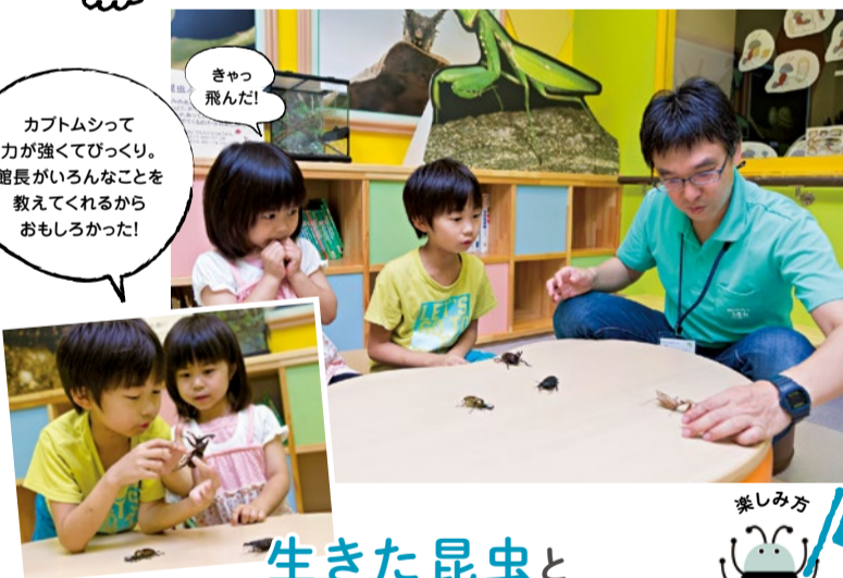
カブトムシって力が強くてびっくり。館長がいろんなことを教えてくれるからおもしろかった!