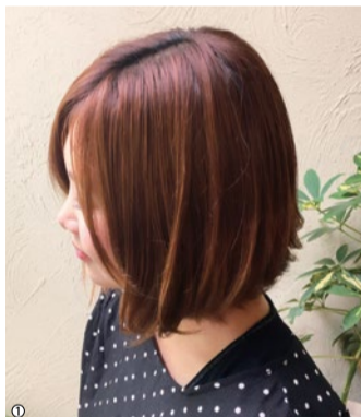
1.再現性の高いカットにも定評があり、スタイリングが楽になったと実感。2.2Fはキッズルームがあるので安心して利用できる。