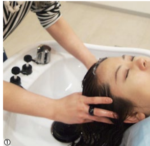
1.頭皮の汚れをスッキリさせ、髪の毛のダメージを改善。マッサージで癒されながら心も頭もリフレッシュ!

カット+トリートメント+ヘッドスパ +炭酸シャワー&炭酸シャンプー 7,020円 → 4,000円 (8月末まで)