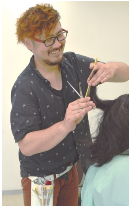
手早いカットで満足の仕上がりに。自宅でのケアが楽になると好評。

シティライフ読者 特別限定 menu つくってもらいました ベタつき 色の退色 パサつき ホームケア で悩む人に