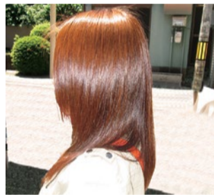
和装プロによる浴衣着付け&ヘア。レンタルはクリーニングせずそのまま返却BOXに入れるだけ、という手軽さと低価格で毎年大人気!