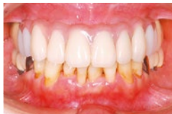
インプラント治療後、10年経過後の状態

10年前にご友人の勧めで来院されました。出産を引き金に歯磨きがおざなりになっていました。歯が、出会った時に抜歯し選択肢がありませんでした。もう少し早く来院していただければ、違う選択肢があったでしょう。抜歯後はインプラント治療を希望されておられました。ご主人がブリッジをしていて、その影響で他の歯も悪くなってきたのを目の当たりにしていただいたこと、ご友人からインプラントして人生変わったよ」と聞いたことが理由です。手術後、「なんら違和感がなく自分の歯と全く同じ」と、とても満足されておられ、その後ご主人もインプラントにされました。今でも問題なく、ご夫婦でメンテナンスに連れておられます。