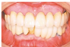
インプラント治療後、30年経過後の状態

この方は30年前に6本インプラント手術をされましたが、今でもしっかりと噛むことができていると、30年の間に病気になるはらたりました。その度にケアをしてきました。きちんと定期検診に来院されていること、セルフケアをしっかりと行われていたこと、今でも維持できています。軽い認知症になられておられますが、歯磨きが習慣化しておられたら、今でもかかさず歯磨きはされておられるようです。インプラントをしていないに比べて、日々のメンテナンス、定期検診はとも大切なことです。歯がなくては食事のままならず、健康そのものに直接的な影響を及ぼします。自分のこととして認識し、悪くなる前に予防を心がけてください。