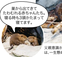
巣から出てきてたわむれる赤ちゃんたち。寝る時も3頭かたまって寝てます。

夜行性のアメリカビバーは巣の中で子育てをするため、巣の中にいることが多いのですが、今では昼過ぎになると巣から出てきて泳ぎだすようになりました。キュレーターが定期的に、3つ子たちの体重測定を行うので、その