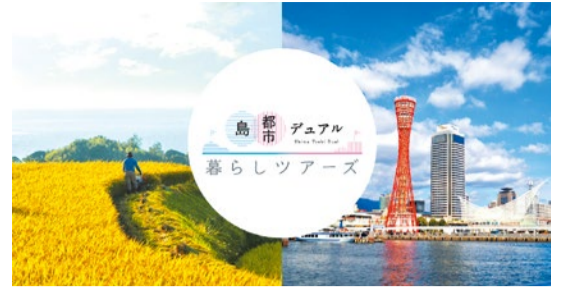
神戸の秘境の里山で過ごす!大人と子どもの夏休み体験!開催日:8/18(土)

移住者の呼び込みを目的に、神戸市・芦屋市・淡路市・洲本市の4市は合同プロモーション事業『島&都市デュアル暮らしツアー』を展開。「デュアル」とは「2つの」を意味する言葉で、自然豊かな淡路・洲本と都市である神戸・芦屋は海を挟み隣接することから、「地方と都会」両方のいいとこどりをした暮らしができると提案している。渋谷や新宿でもイベントを開催するなどして首都圏での発信も行っている。