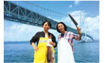
漁師町の老舗魚屋さんが伝授!“さばける女”になるツアー開催日:今秋開催予定