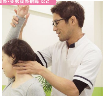
親身に話を聞いてくれ、わかりやすく説明してくれるので「自分の知らなかった体の状態がしっかり理解できた」という声も多い。

「ろっ骨」は胸であり、肩であり、わきであり、背中でもある」と院長。「ろっ骨」は背骨から胸までをぐるりと取り囲む鳥かごのようなつくりなので、そこがかたいと上半身がしなやかに動かず、猫背や平背、右肩下がりがたかくなっている背中、首・肩・腰の動きもかたまってしまおう。同院の施術では、重要なのに見落とされがちな「ろっ骨」への独自アプローチにより、姿勢のバランスが整い、痛みや違和感をやわらげるだけでなく、再発しにくく疲れがとれやすいカラダに導いてくれる。その即効性と持続性に来院者の信頼は絶大!