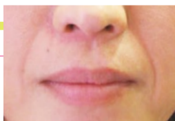
※厚生労働省認可ヒアルロン酸も取り扱っています。

額のしわ 10,000円 眉間のしわ 10,000円 プチ小顔 20,000円 眉間や目尻の表情ジワが目立たなくなります。 ※初回のみ(麻酔代金全て込み) ※厚生労働省認可ボトックスあり