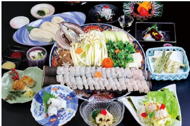
【鱧(はも)御膳プラン】