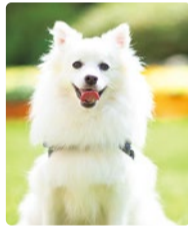
ロハスフェスタ広島 2018グランプリ受賞

ベストショットでワンちゃんフォトコンテスト ワンちゃんと一緒に遊びに行けるロハスフェスタ。会場内ブ ースでエントリーシートをもらって、ロハスフェスタ公式サイト 内「ワンちゃんフォトコンテスト」ページにUP。たくさんの「い いね!」を集めた写真がグランプリです。1等賞にはステキな プレゼントをご用意しています。参加賞もあります。