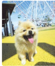
ロハスフェスタ淡路島 2017グランプリ受賞

おえかきエコバッグ 参加費 1枚 300円 自由にお絵描きしたり、ステンシルで自分だけのオリジナルエ コバッグを作ろう! 皆様からの参加費は緑化事業への寄付に 充てられます。 協力:公益社団法人ゴルフ緑化促進会