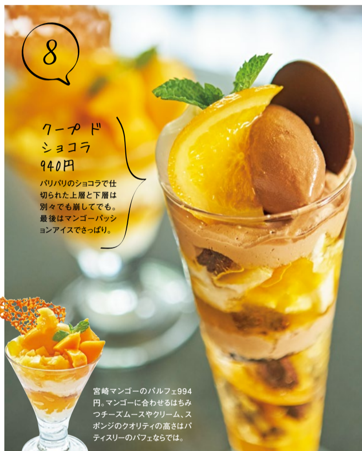
クープド ショコラ 940円 バリバリのショコラで仕 切られた上層と下層は 別々でも崩しても。 最後はマンゴーパッシ ョンアイスでさっぱり。