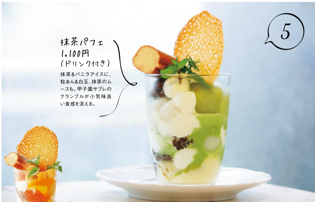
抹茶パフェ 1,100円 (ドリンク付き) 抹茶&バニラアイスに、 粒あん&白玉、抹茶のム ースも。甲子園サブレの クランブルが小気味良 い食感を添える。