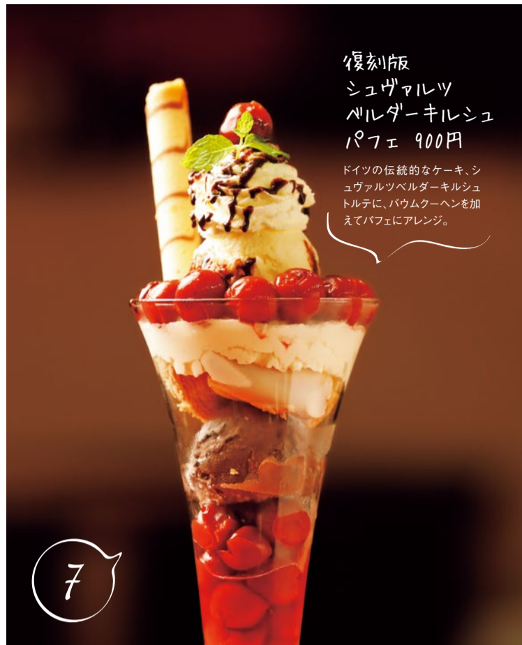
復刻版 シュヴァルツ ベルダーキルシュ パフェ 900円 ドイツの伝統的なケーキ、シ ュヴァルツベルダーキルシュ トルテに、バウムクーヘンを加 えてパフェにアレンジ。