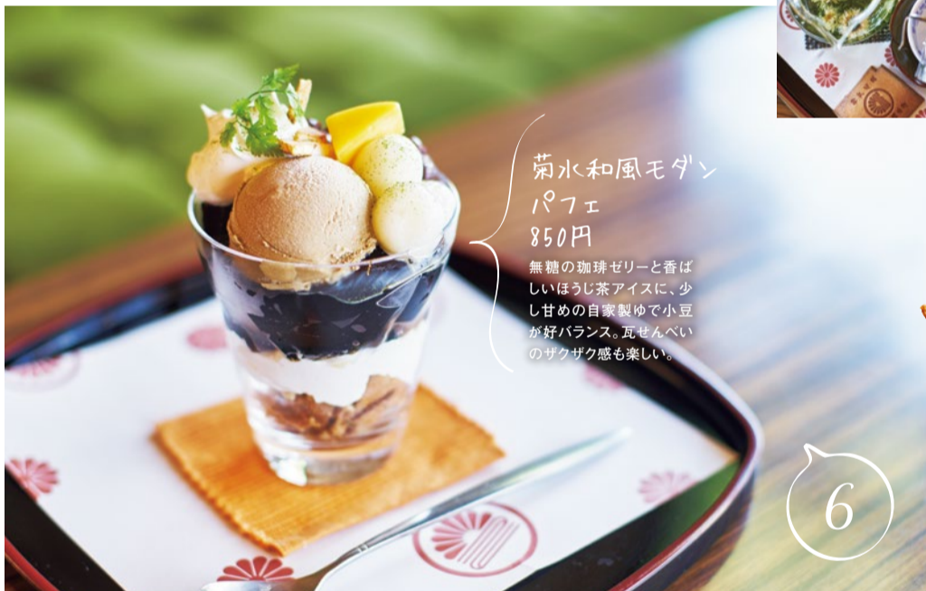
菊水和風モダン パフェ 850円 無糖の珈琲ゼリーと香ば しいほうじ茶アイスに、少 し甘めの自家製ゆで小豆 が好バランス。瓦せんべい のサクサク感も楽しい。