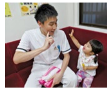
対処が早い方が、その後の改善に期待が持てる。家族が驚くほどの回復を見せることも!