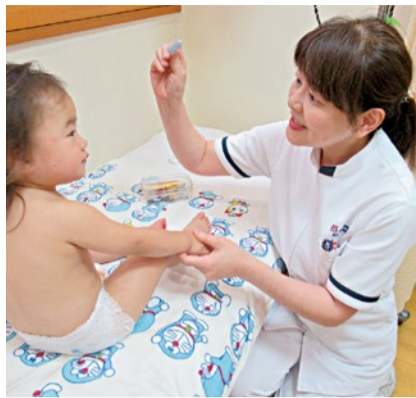
針は小鳥が顔を ついばむほどの刺激。小児てんかんや自閉症、発達遅滞、言葉の遅れ、チック、多動、目・鼻・口・耳・喉の不調など、あきらめずに一度相談を。

90年以上の実績があり、子どもの難しい健康トラブルに全国から続々と相談が寄せられている同院。独自の「新脳針療法」を頭部や手足に施すことで子どもの脳神経細胞を活性化、脳内ホルモンの分泌を促して発達や言葉の遅れを改善し、暴れたりパニックになる症状を落ち着かせる。「言葉が増えた」「偏食や便秘がなくなった」「たった数回で改善した」など喜びの声が多く、ラクに日常生活を送れるように。施術や改善事例が充実しているHPも要チェックを。わが子の事で気になることがあればぜひ頼ってみて。