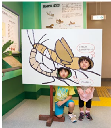
写真はママやパパに撮ってもらって、おうちやお店のプリンターで出力して貼ってね!