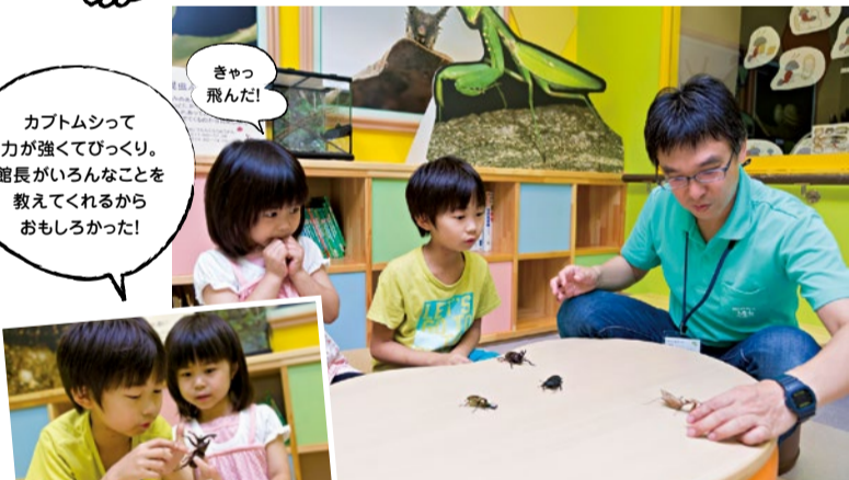
カブトムシって力が強くてびっくり。館長がいろんなことを教えてくれるからおもしろかった!