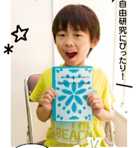
自由研究にぴったり!

そして7月28日(土)~8月31日(金)まで、特別企画「館長おすすめの“ちょっと面白い昆虫”で遊ぼう」を開催! 5つの特徴ある昆虫(例えば世界最長や世界最小の昆虫など)をテーマに、わかりやすい解説が載ったワークシートを手に、館内5つの場所にあるそれぞれの展示を見学しよう。展示場所には顔出しパネルや背比べパネルで昆虫になった気分の写真を撮ることができるよ。シートに自分の感想を書いたら完成!