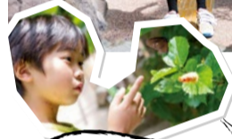
花の蜜を吸っていたり、葉っぱに止まっていたり。そっと近づいて見ると発見がいっぱい。