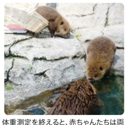
体重測定を終えると、赤ちゃんたちは両親が泳ぐ水の中へ。性別は成長後に血液検査で判別予定。