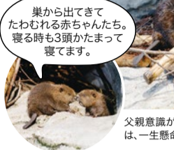
巣から出てきてたわむれる赤ちゃんたち。寝る時も3頭かたまって寝てます。

夜行性のアメリカビバーは巣の中で子育てをするため、巣の中にいることが多いのですが、今では昼過ぎになると巣から出てきて泳ぎだすようになりました。キュレーターが定期的に、3つ子たちの体重測定を行うので、その