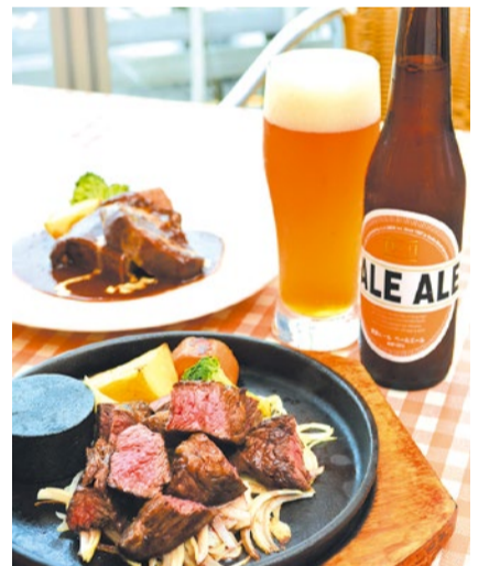
鉄板ビーフステーキはライス付きで1,680円(税別)。牛タンシチュー1,800円(税別)も定番の人気メニュー。地元の箕面ビールも扱う。

特典 「シティライフを見た」で単品料理注文で サラダバーセット分をランチ300円OFF、ディナー半額 (8月末まで・他券併用不可)