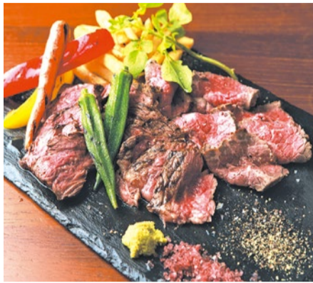
自家製ローストビーフ(1,000円)は自慢の一品。肉の盛り合わせ(2,000円)やハラミ、ミスジ、ザブトンなどの単品ステーキ(900円〜)もおススメ!

ローストビーフやステーキ、焼き肉にしゃぶしゃぶ…。肉を愛してやまない人々に極上の味をお届けします。