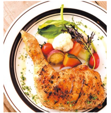
骨付き丹波地鶏と季節野菜のロースト 2,000円 ※15時以降の提供

「シティライフを見た」で骨付き丹波地鶏と季節野菜のローストをオーダーの方、 本日のスープ、自家製フォカッチャをサービス (8月末まで)