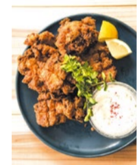
「バターミルクフライドチキン」…880円 ジューシーかつスパイシーな本場アメリカのチキンはビールとの相性も抜群! ※15時以降の提供