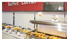
フライドチキンはもちろん、サイドメニューも充実の「カーネルバフェ」コーナー。

大好評！フライドチキン食べ放題の「カーネルバフェ」コーナーを設けている小野原店。おなじみのフライドチキンはもちろん、ビスケットやチキンナゲット、クリスピー、パスタ、カレー、サラダなどのサイドメニューにフルーツ、ソフトクリームなどのデザートまでバラエティに富んだ内容。さらにドリンク飲み放題なので夏休みのランチ・ディナーにおすすめ！8名以上から予約もOK。思い出すと無性に食べたくなるフライドチキンを家族で、友だちと心ゆくまで堪能しよう！