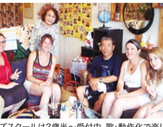
キッズスクールは2歳半～受付中。歌・動作化で楽しく学習!楽しくアットホームが自慢の教室。