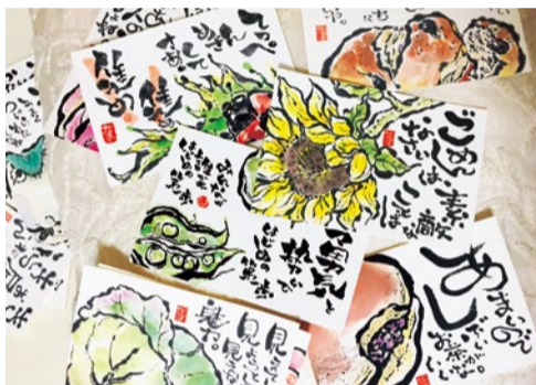
植物や果物など季節感を伝える絵と話し言葉で描かれる。

【教室情報】今秋、茨木で自主開催の教室を開講予定。ブログで情報発信するので、ぜひチェックを。問合せは下記Webサイトに記載のメールアドレスへ。 https://profile.ameba.jp/ameba/tama-post (ブログ) https://ameblo.jp/tama-post/