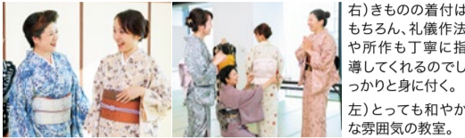
右)きもの着方体験、礼儀作法や所作も丁寧に指導してくれるのでしっかりと身に付く。 左)とっても和やかな雰囲気のある教室。